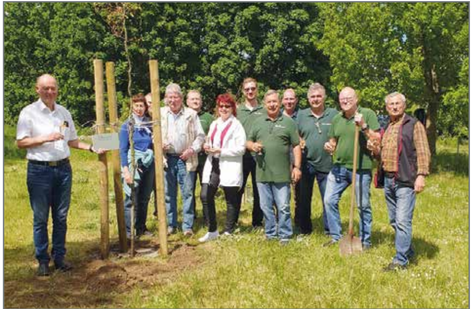
Das gemeinsame Pflanzen der Rotbuche mit den Partnervereinen auf dem Vereinsgelände des Barleber Schützenvereins.

Eine stattliche Rotbuche wurde zum Tag des Jubiläums am 27. April zum Schützenplatz geliefert. Da die Schützen mit diesem Geschenk überrascht wurden, waren an diesem Tag für das Einpflanzen natürlich auch keine Vorbereitungen getroffen worden. In würdiger Form erfolgte die gemeinsame Pflanzaktion dann im Mai. Die Schützen und Schützinnen bedankten