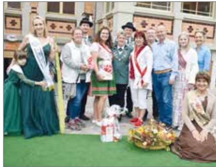
Traditionell finden sich beim Erntefest die Majestäten des Festes und der Umgebung zum Gruppenfoto zusammen, hier ein Bild von 2022.

Region besteht, prämiert. Der Heimatverein nimmt vorher die Objekte der Teilnehmer, die diese anonym abgeben, an. Diese werden mit einer Nummer versehen und dann von der Jury bewertet. So weiß niemand vorab, wer die jeweilige Siegerin oder der jeweilige Sieger ist. Natürlich geht es nicht nur um Blumen und Früchte – auch an ein buntes Unterhaltungsprogramm für alle Gäste ist gedacht: Spielangebote