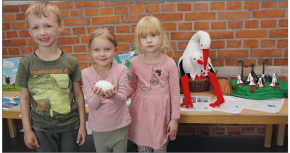
Alles rund um den Storch wird auch am Tag der offenen Tür präsentiert.

>> In den vergangenen Wochen erlebten die Kinder der Kita und des Hortes in Barleben ein spannendes und lehrreiches Projekt rund um das Thema Storch. Mit viel Begeisterung und Kreativität tauchten die kleinen Entdecker in die faszinierende Welt dieser majestätischen Vögel ein. Sie lernten viel über die Lebensweise und den Lebensraum der Störche. Die Erzieherinnen und Erzieher der Einrichtung nutzten eine Vielzahl an Büchern, um den Kindern ein umfassendes Bild von diesen beeindruckenden Tieren zu vermitteln. Geschichten und Sachbücher über Störche wurden vorgelesen und gemeinsam besprochen. Die Kinder erfuhren, woher die Störche kommen, wohin sie ziehen und was sie gerne fressen. Ein besonderer Punkt war der beinahe lebensgroße Storch „Frida“, den eine Erzieherin extra samt Ei und Nachwuchs „Karl“ zur Anschauung für die Kinder gehäkelt hatte. Neben der theoretischen Wissensvermittlung kamen auch kreative Aktivitäten nicht zu kurz. Die Kinder