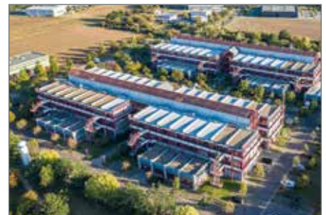
Im Technologiepark Ostfalen in Barleben ist mit Bundesfördermitteln in Millionenhöhe eine hochmoderne 5G-Netzinfrastruktur für die industrielle Nutzung entstanden.

Barleben war eine von 10 Modellregionen in Deutschland und die einzige in Sachsen-Anhalt, die im Rahmen des „5G-Innovationswettbewerb“ des