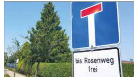
Ein Teil der Dahlenwarsleber Straße wrd im Juli gesperrt.

>> In Barleben beginnen in Kürze die erschließenden Baumaßnahmen für die Erweiterung des Wohngebietes „Schinderwuhne“. Als Erstes werden die einzelnen Versorgungsmedien, wie Strom, Wasser und Abwasser verlegt. Für den dafür notwendigen Tief- und Rohrleitungsbau wird eine Baustelle eingerichtet. Aufgrund dessen ist die „Dahlenwarsleber Straße“ auf Höhe der „Schinderwuhne“ ab dem 8. Juli 2024 für den Fahrzeugverkehr voll gesperrt. Die Bauarbeiten werden voraussichtlich nach drei Wochen beendet sein. Eine Umleitung ist ausgeschildert. (tz)