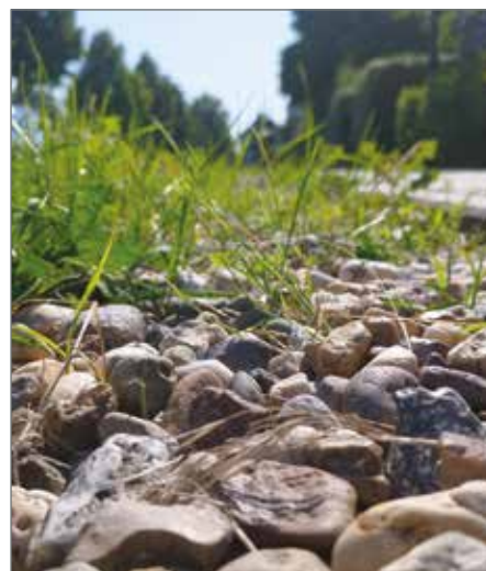
Rigolen müssen regelmäßig vom Unkraut befreit werden - allerdings nicht mit Gift, sondern in Handarbeit.

Die Straßenreinigungssatzung der Gemeinde Barleben ist da eindeutig und erklärt im Rahmen der Straßenreinigungspflicht: „Die