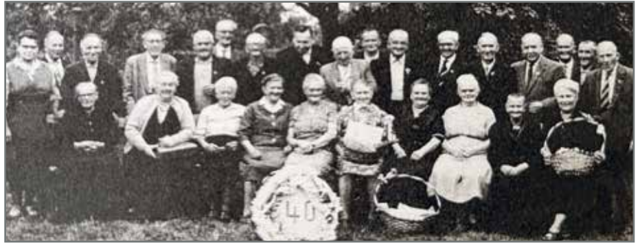
Schon immer eine fröhliche und zuversichtliche Gemeinschaft.

Dann kam die Wende und alles wurde anders: Der VKSK verschwand in der Versenkung, stattdessen entstanden neue Vereine. Auch unser Geburtstagskind änderte den Namen und schloss sich dem „Kreisverband für Kleingärtner Wolmirstedt e. V.“ an, der seinen Mitgliedern viele administrative Aufgaben abnimmt – zum Beispiel die Abwicklung der Pachtzahlungen.