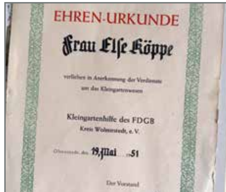
Eines der ältesten Dokumente des Gartenvereins.

Unter anderem gilt deshalb für neue Pächter das erste Jahr als „Probezeit“. „Es kann ja auch sein, dass ein Frischling feststellt, dass Gartenarbeit nichts für ihn ist und er sich ausschließlich der Entspannung widmen möchte.“ Das ist auch einfach zu ermitteln: Wird in einem neu übernommenen Garten geerntet, leuchtet die Mitgliedsampel grün. Wenn nicht, setzen sich Vorstand und das Mitglied zusammen und beraten, wie es weitergeht. Neben der Hege und Pflege eines Gartens, der bis zu 600 Quadratmeter groß sein kann, spielt das Miteinander der Vereinsmitglieder eine wichtige Rolle: Zum Beispiel gemeinsames Grillen nach den Aufbaustunden, die jeder leisten muss; sonst werden 25 Euro für jede 60 Minuten fällig. Grünkohllessen im Januar,