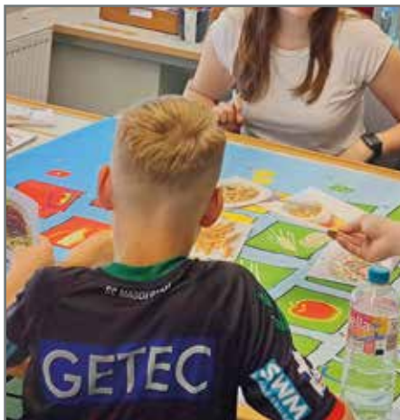
Bei der Ernährungspyramide informierten sich die Schülerinnen und Schüler, welche Lebensmittelgruppen im täglichen Essen wie oft vorkommen sollten.

„In Schulen gibt es vielseitige Ansatzmöglichkeiten, die Gesundheitskompetenzen der Lernenden im Hinblick auf ein gesundes Ernährungsverhalten zu sensibilisieren und zu